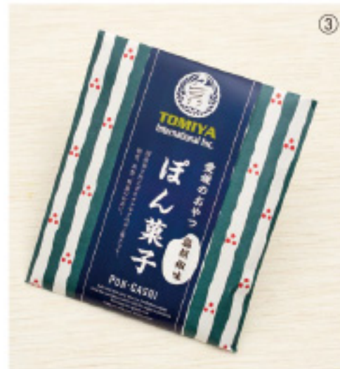
賞味期限:6ヶ月 内容量:35g

塩胡椒をまぶした大人が楽しめるボン菓子です。ビールやお酒のおつまみにぜひどうぞ。