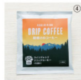
賞味期限:12ヶ月 内容量:10g