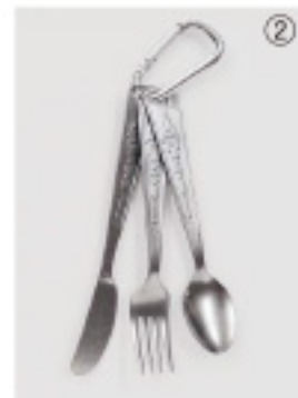
サイズ: スプーン 160mm フォーク 163mm ナイフ 171mm