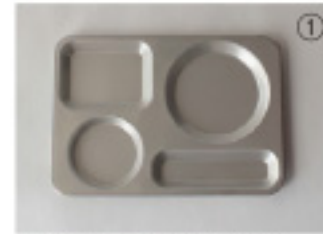
サイズ / 290×205×H15mm

マグカップ、 コーヒーマーサー、 スイーツ、カトラリーなど コンパクトに まとめることができます。 アウトドア用の食器として おすすめです。