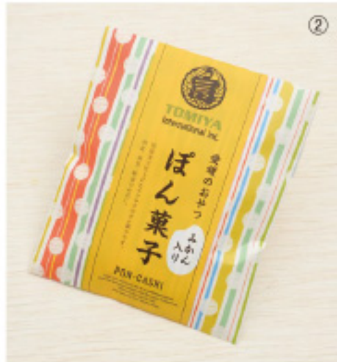
賞味期限:6ヶ月 内容量:35g