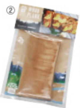
② ウッドプランク 煙板 カク