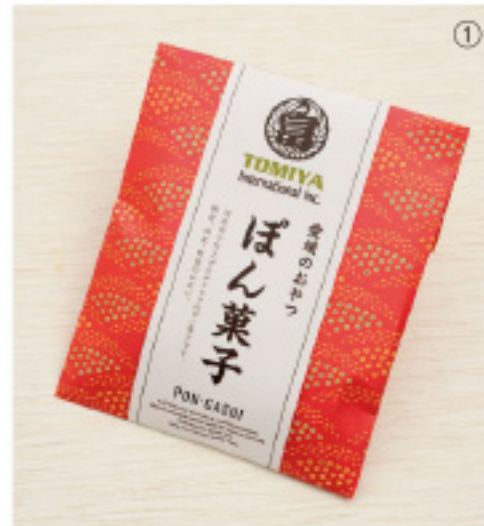
賞味期限:6ヶ月 内容量:35g