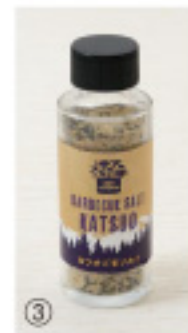
カツオ胡麻ソルト

賞味期限:12ヶ月 内容量:64g アヒージョやペペロン チーノが簡単に作れま す。生のにんにくを剥く 手間もありません