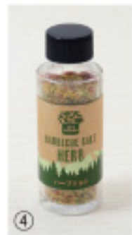
ガーリックソルト

賞味期限:12ヶ月 内容量:33g 野菜にサッと振り掛け たり、麺類・スープに入 れたり、焼き鳥、鍋、ラ ーメン等用途も様々。