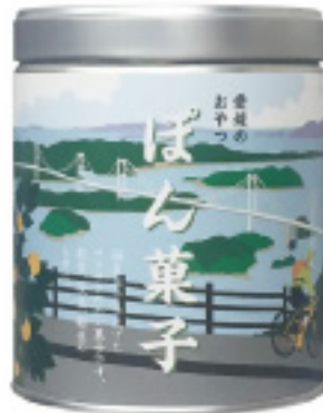
賞味期限:④⑤⑥6ヶ月 内容量:④⑤⑥55g