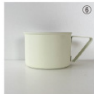
容量:約280ml サイズ:W130×Φ90×H63mm カラー:ホワイト、グリーン、 ブラック、シルバー

庭先、ピクニック、グランピングなど、 気軽に外に持ち出せるマグカップです。 V字のハンドルは手になじみやすく、 本体は倒れにくい安定感があります。 4種類のカラーが揃っています。