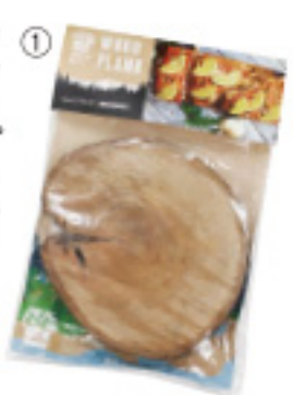
① ウッドプランク 煙板 マル