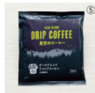
賞味期限:12ヶ月 内容量:10g